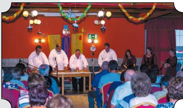
A mélykúti Szederinda Citerazenekar