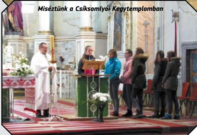
Miséztünk a Csíksomlyói Kegyetemplomban