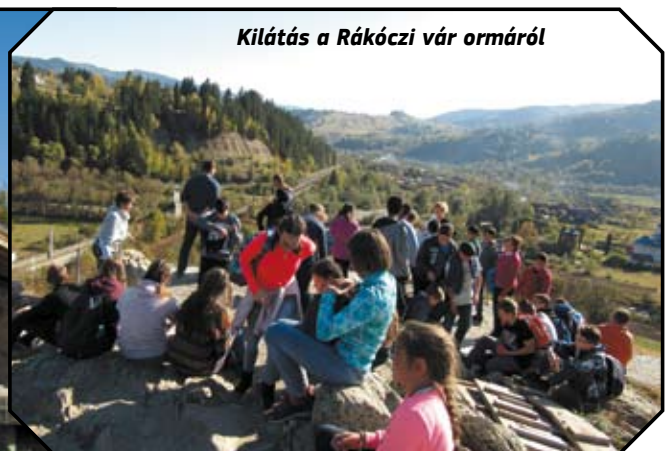
Kilátás a Rákóczi vár ormáról