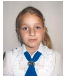
Kiss Dalma 2.b.