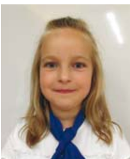
Kiss Karina 1. b.