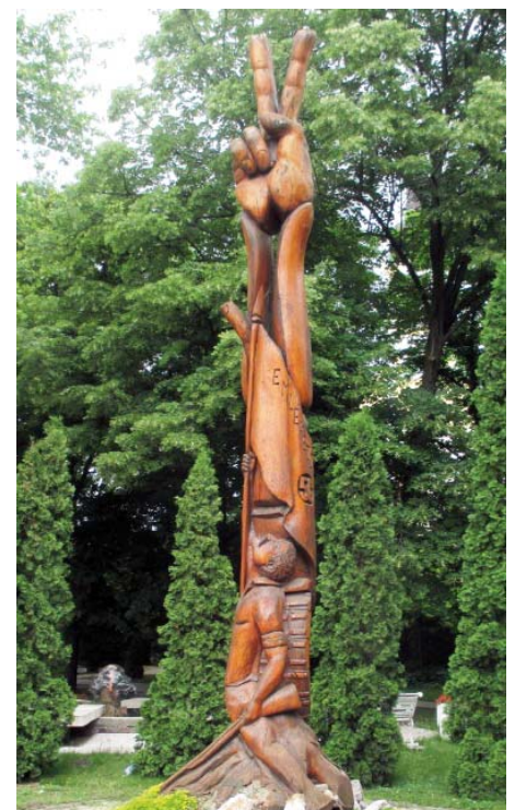
'56-os emlékmű. Pálosi Mihály alkotása.