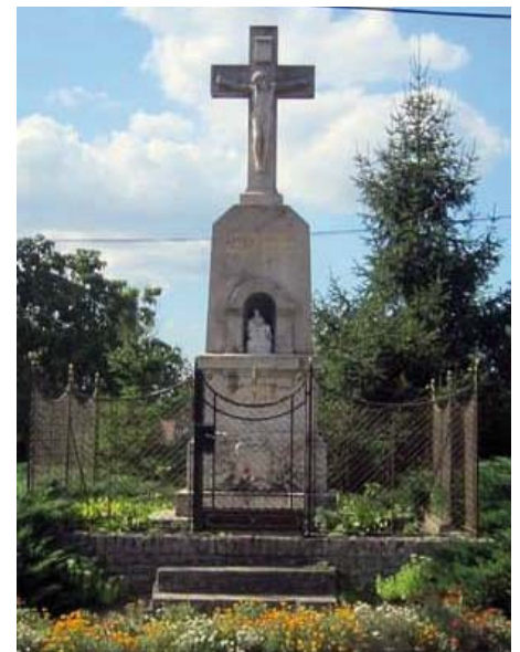
I. világháborús emlékmű - Mélykút Felirat: Krisztus győz, Krisztus uralkodik, Krisztus parancsol - A világháborúban elesett hősök emlékére - 1917. Anyaga: mészkő, készítője: ismeretlen. Mélykút, Templom utca torkolatában