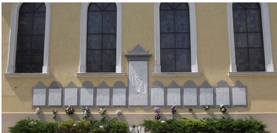
II. világháborús emlékmű