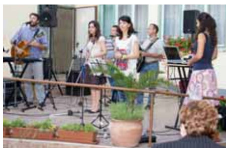
A Szent András Evangelizációs Iskola Misszós Csapata