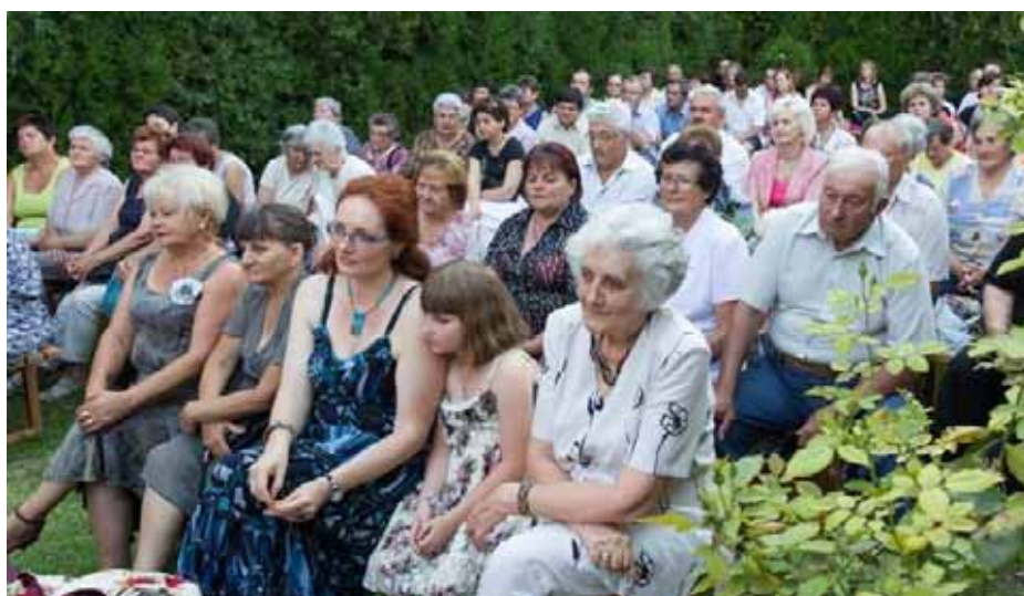
A Csorba-házi esték közönsége