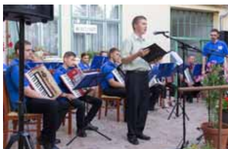
A Madarasi Harmonikások Alapítvány Zenekara