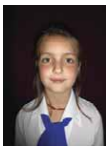
Vismeg Ninetta 1.b