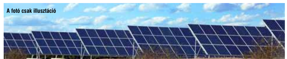
A fotó csak illusztráció