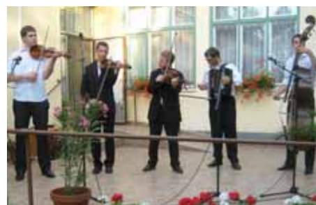
Az óbcesei Fokos Zeneka