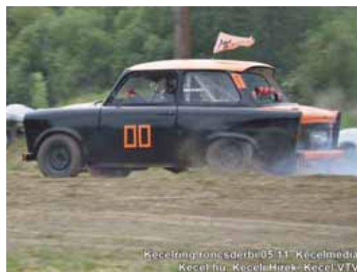
Kecelring rendezéséről 05:11 Kecel média Kecel.hu, Kecel Hírek, Kecel TV