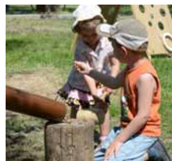
Népi játékok – Diótörő 2