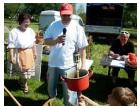
Olimpiai láng meggyújtása