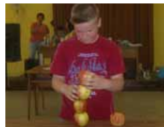
Egy perc és nyersz