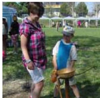
Népi játékok – Csirkepofozó