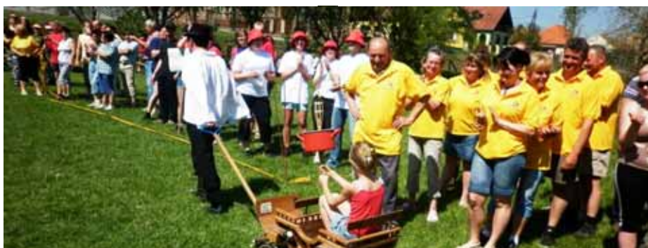
Útjára indul az olimpiai láng a felsorakozott csapatok előtt