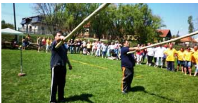
Modern Toldi Miklósok