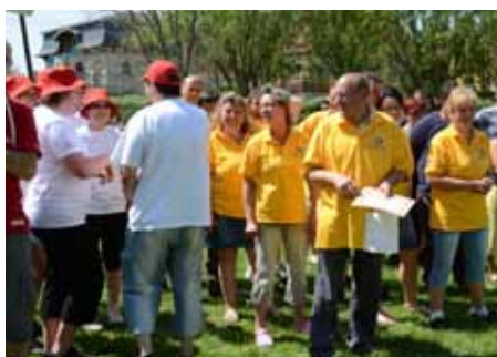
Az eredmény értékelése