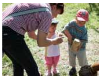
Népi játékok – Diótörő