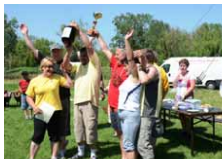
Bakancsosok – A győztes csapat a vándorszerleggel