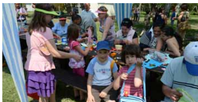
Lázás munka a kézműves sátorban