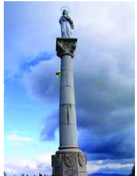
A képen az Asiagói Madonna látható (Olaszország).