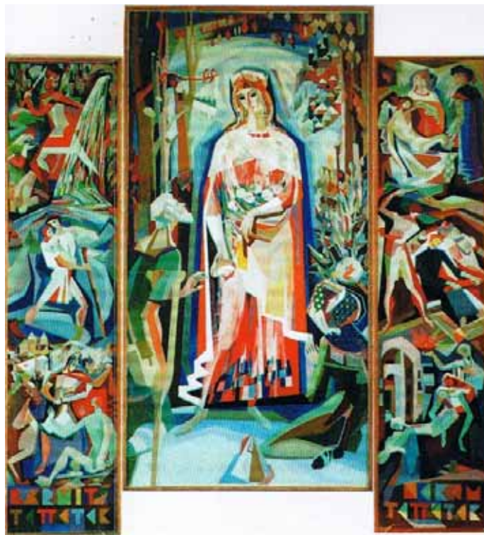
A mélykúti Szent Erzsébet oltár, 1962

A középképet kétoldalt két keskeny, függőleges tábla övezi, amelyen egymás alatt három-három kép ad példát az irgalmaság tetteinek gyakorlására. Balra fent Szent László király nagy hittel üt a sziklára, hogy szomjazó vitézeinek inni adjon, és máris ömlik a forrásvíz! Alatta, Szent Kristóf viszi át a folyón az embereket, és az egyik gyermekben Krisztus szól hozzá. Majd Szent Márton, a római lovas katona, Amiens városkapujában megáll a mezítelen láttán, és kettészeli köpenyét, hogy betakarja őt.