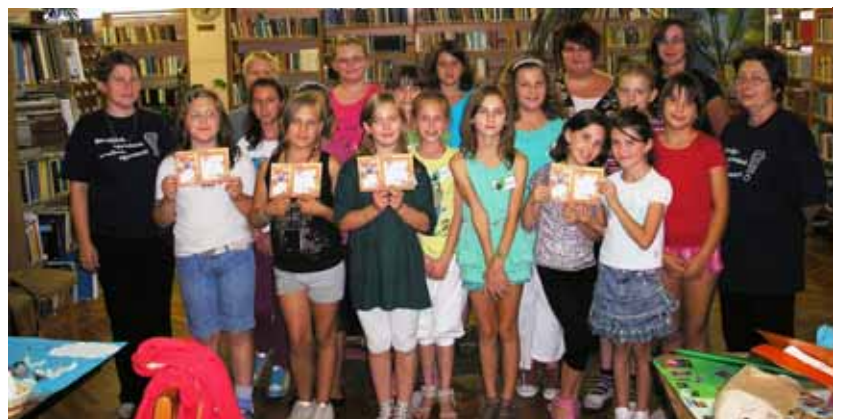
„Ökoügynökök, előre!” – „Pizok” jó vetélkedő