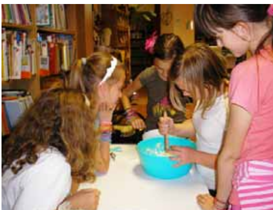
„Süssünk, süssünk valamit ...” – Tócsni és lábatlan sütés