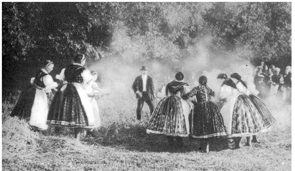
Szent Iván-i tu'zugrás (Karancseszki, Nógrád m., 1930-as évek)