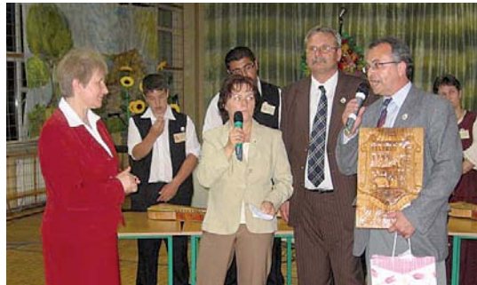
A mélykúti iskola igazgatója ajándékot ad át a lengyelek igazgatójának