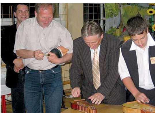
Az ajándék hangszereket próbálják megszólaltatni lengyel barátaink