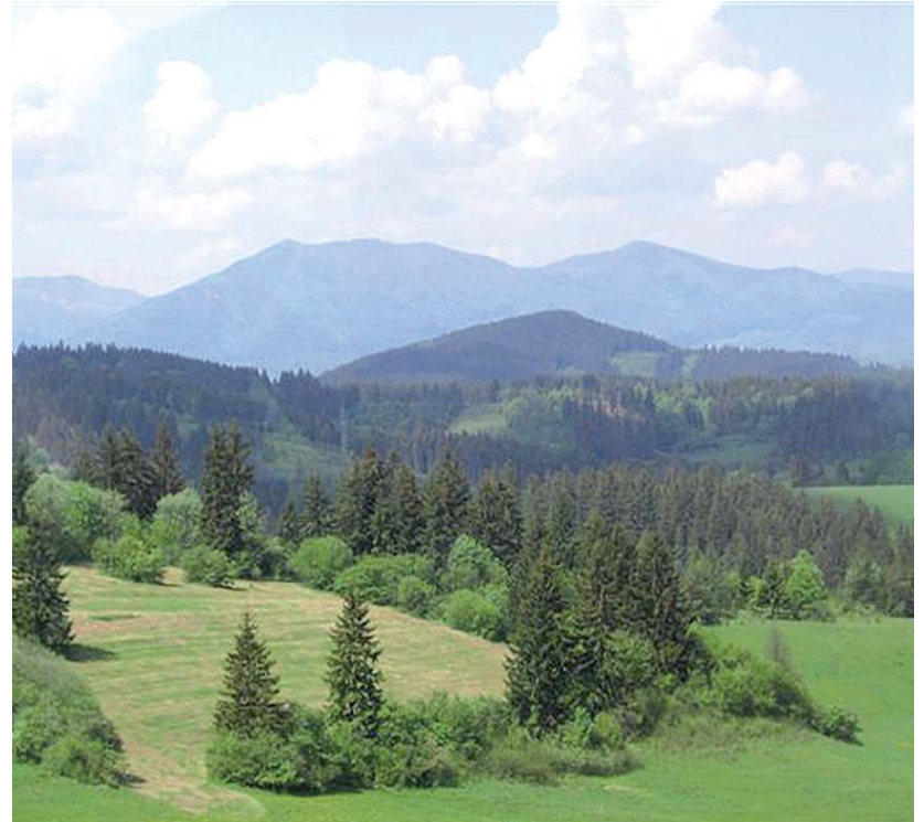
A gyönyörű táj lenyugozott bennünket oda- és visszaútban is