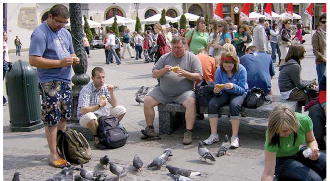
Krakó főterén, a Rynek Glówny