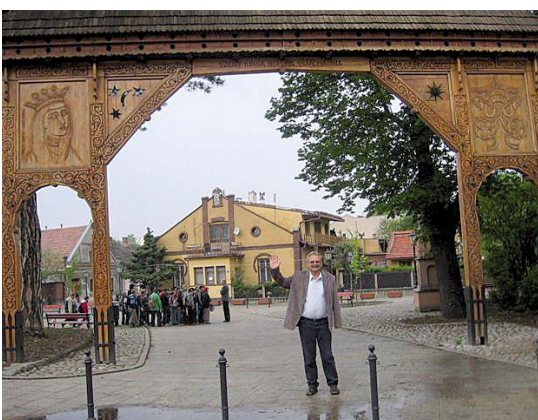
Stary Sacz - a székykapu, ahol II. János Pál pápa is áthaladt