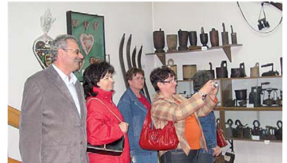
A Regionális Múzeum gazdag gyűjteményét csodáltuk