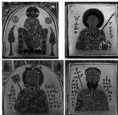
Szent Korona részletei:

Az egyesítés következtében a nyitott, görög abroncskoronából boltozatos, zárt korona lett. Ennek a zárt koronának a rendeltetése a továbbiakban nem lehetett más, mint első, szent királyunknak emlékét, eszméit örökösen ébren tartani. A Szent Korona szent jelzőjét ez az egyesített zárt korona kapta, mert ehhez tapadt Szent István személyes emléke. Megkérdőjelezhetetlen ősi szokássá vált az, hogy Magyarország királya csak az lehetett, akit Szent István koronájával az esztergomi érsek Fehérvárott szentelt fel. E három feltétel közül egyik sem hi-