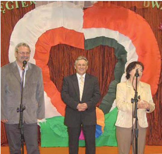
Igazán pazar fogadásban volt részünk - baráti köszöntő, gazdag vacsora, gyönyörű díszlet