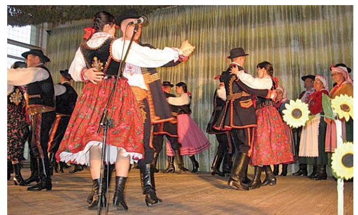
A MSZALNICZANIE táncgyűttes fergeteges műsort adott a búcsúesten