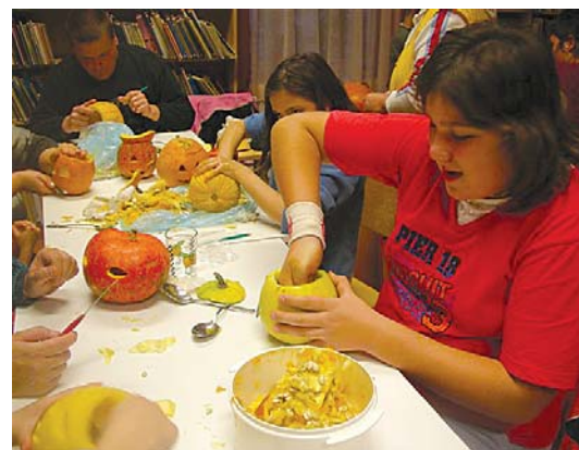
Töklámpás készítő verseny