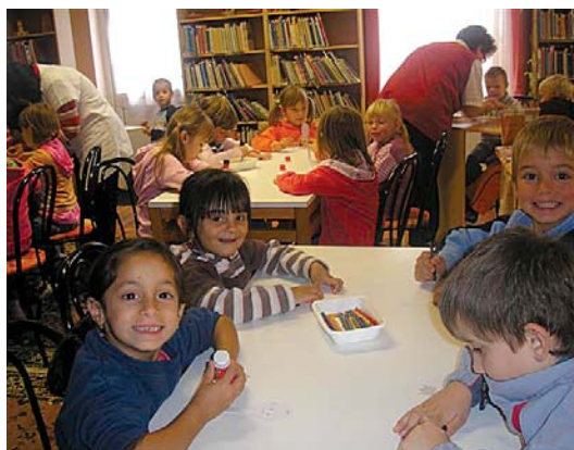
Mátyás király igazszondó juhásza – óvodás foglalkozás