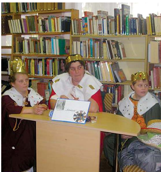
Mátyás az igazságos - családi mesevetélkedő