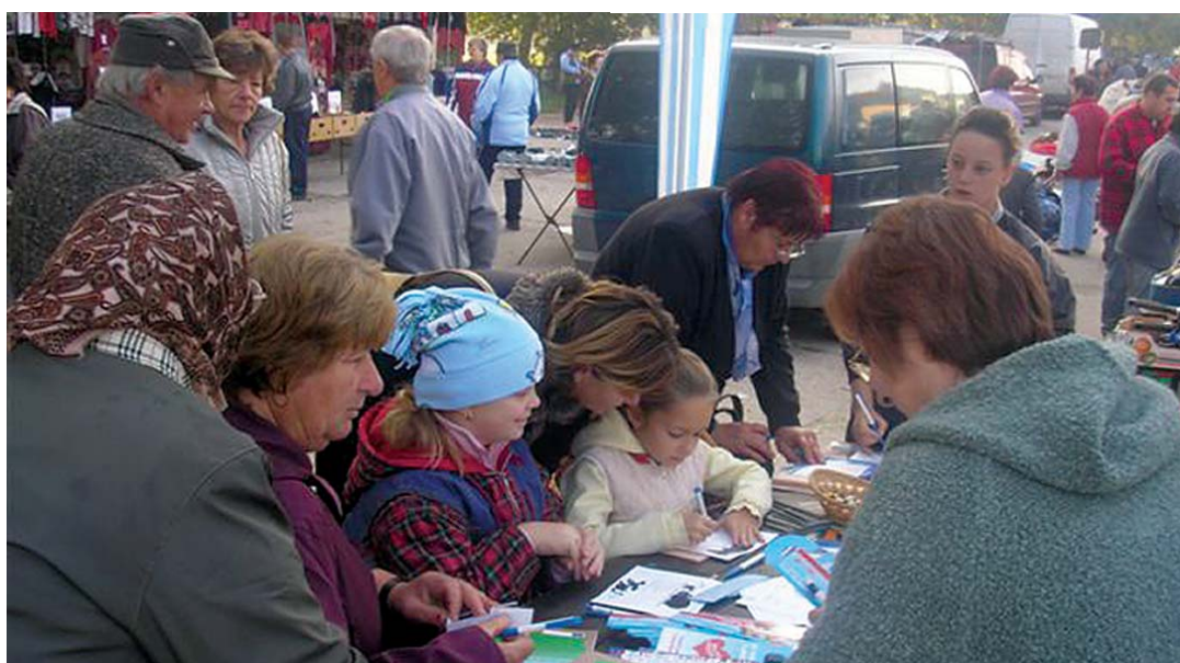
Piacon a könyvtár