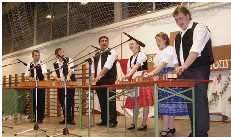
Az elvetett mag szárba szökkent...