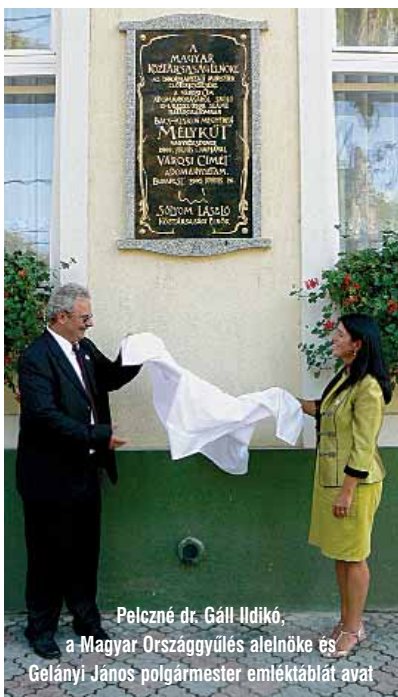
Pelczné dr. Gáll Ildikó, a Magyar Országgyűlés alelnöke és Gelányi János polgármester emléktáblát avat

Mostani lapszámunk első oldala eszünkbe juttatja majd, hogy 2009. augusztus 15-e városavató ünnepségünk, mint jövőt formáló önkormányzati döntés megvalósulása, történelmi esemény volt. Városavató ünnepségünket – sok-sok visszajelzés alapján – igen magas színvonalon rendeztük meg. Voltak segítők, akik anyagiakban támogattak bennünket, s voltak, akik a szervezési feladatok végrehajtásában segítettek. Ez az oldal képes beszámolója most nekik szól a köszönet kinyilvánítása gyanánt. Jólesett ennyi szervezetet és segítő kezdet magunk mögött tudni programjaink végrehajtásánál.