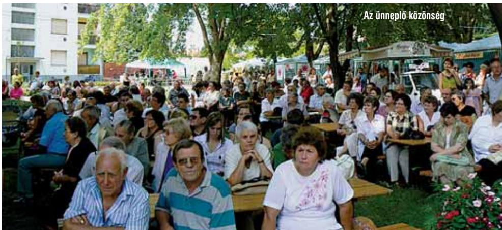
Az ünneplő közönség