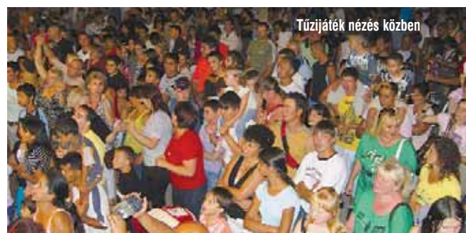
Tűzijáték nézés közben