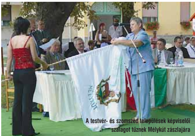
A testvér- és szomszéd települések képviselői szálat tűznek Mélykút zászlajára