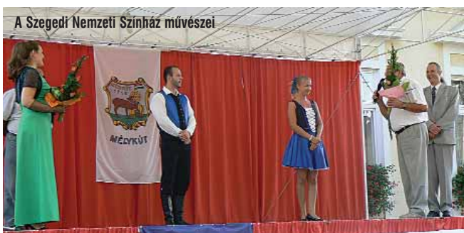
A Szegedi Nemzeti Színház művészei