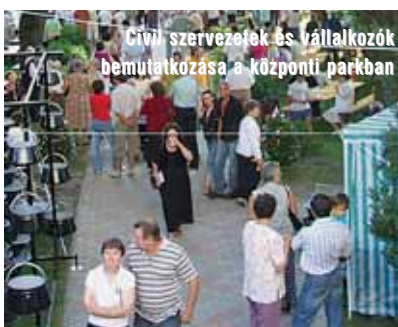
Civil szervezetek és vállalkozók bemutakozása a központi parkban