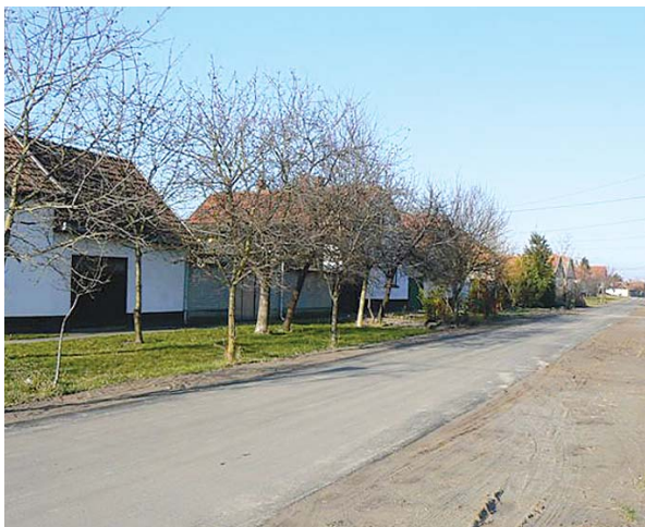
A Nagy utcai útépités LEKI pályázatból valósult meg