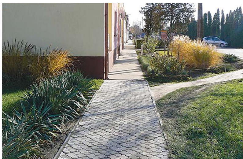
...és a Nagy utcán az orvosi rendelőig önkormányzati költségvetésből készült el