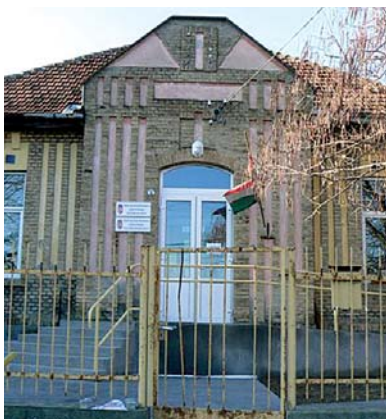
Az Őregek Napközi Otthonának akadálymentesítése és új vizesblokk építése