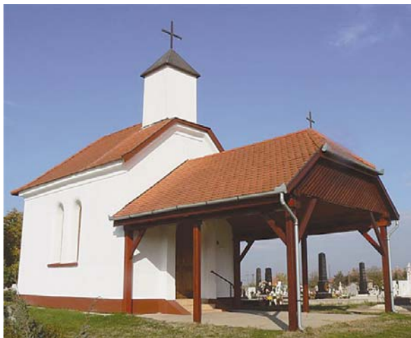
Elkészült a Jánoshalmi úti Kálvária-temető kápolnahomlokzat, belső fal és földem felújítása