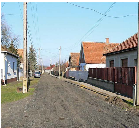
A Kis utca...