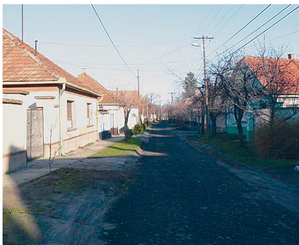
...és a Róza utca elejének felújítása lakossági kezdeményezésre, jelentős lakossági hozzájárulással, önkormányzati támogatással és a Soltút közreműködésével valósult meg