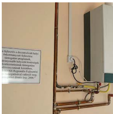
A Polgármesteri Hivatal régi elavult fűtési rendszerét újra cseréltük, ez a fűtési költségek jelentős csökkenését eredményezte