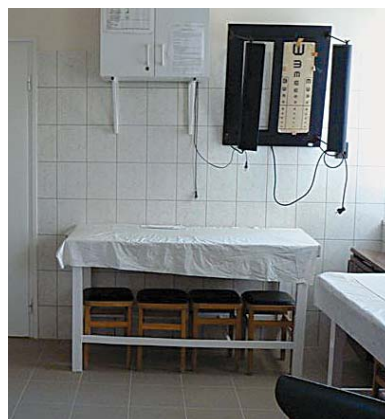
Védőnői Szolgálat épületének felújítása LEKI pályázatból