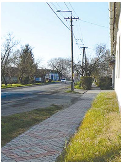
Járda térkövezése a Kossuth utcán a vasútállomásig...