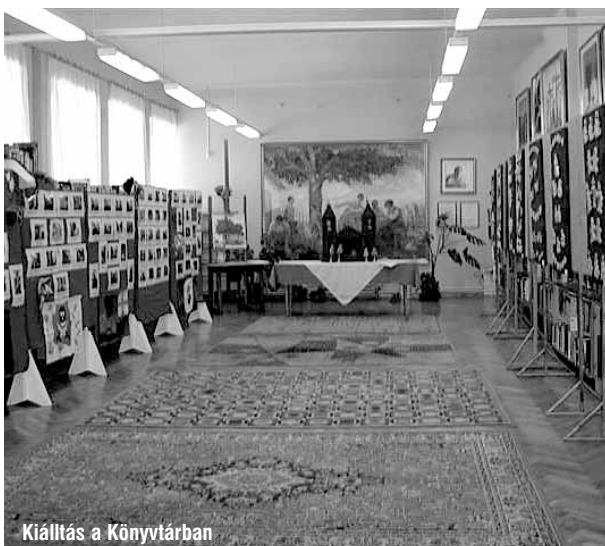
Kiállítás a Könyvtárban