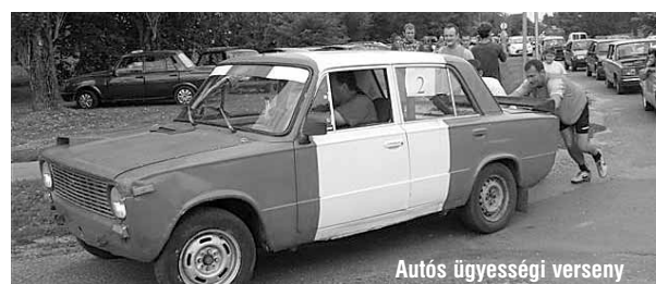
Autós ügyességi verseny