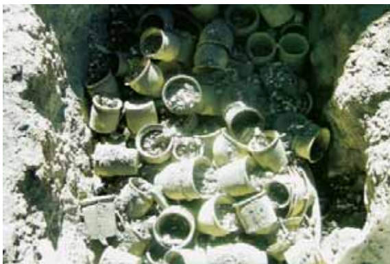
Cserépetetés az Alkotóház udvarán