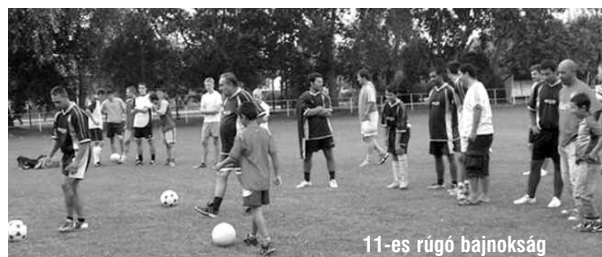
11-es rúgó bajnokság