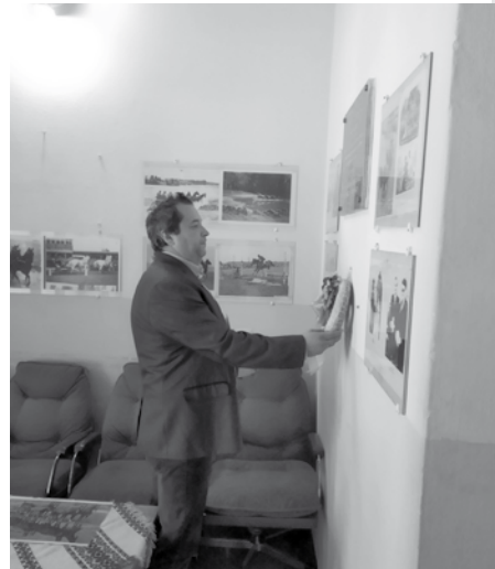
Mélykúti Lovassport Egyesület

A kettes fogathajtó verseny keretein belül a Mélykúti Nagycsaládosok Egyesülete régi hagyományok szálát felszedve, újra megszervezte a Főzőversenyt (Bográcskirályt) melyet ezentúl is minden évben szeretnének megvalósítani. A verseny keretében idén is rendkívül finom ételeket kóstolhattunk.