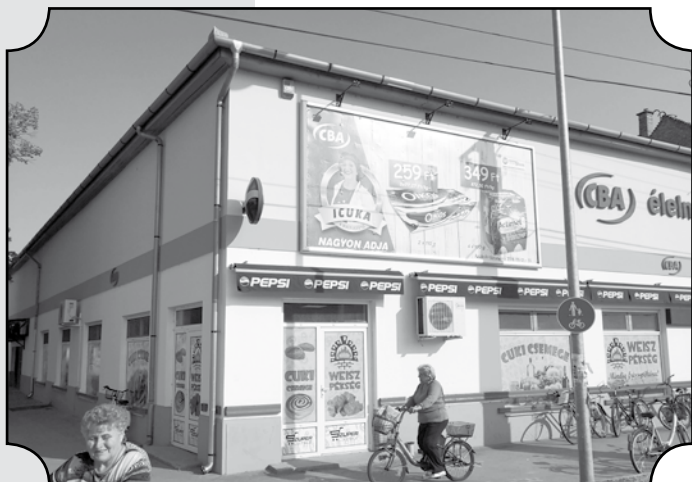
Mélykút, Cuki csemege