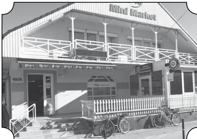
Mélykút, Rákóczi utcai üzlet

Nagyon szeretik a vásárlók a helyi termékeket. Állandóan vál-toztatunk az ízeken, megfogadunk tanácsokat a beszállítóinktól is. Jönnek próbasütésre, havonta egyszer-kétszer új terméket hoznak.