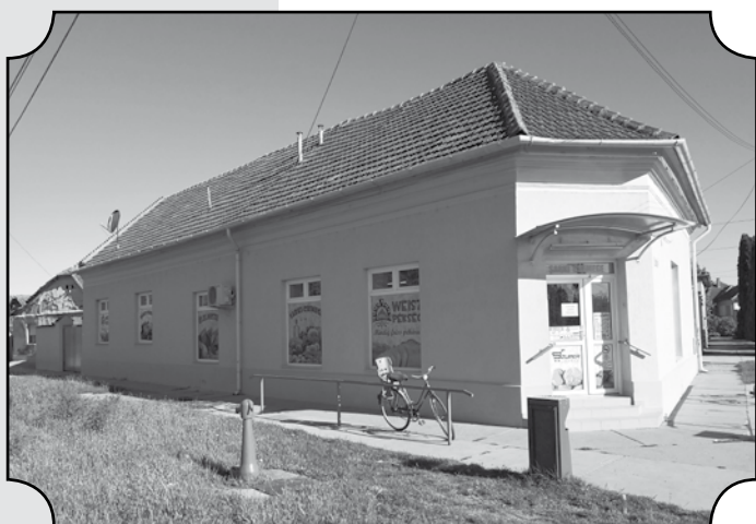
Mélykút, Mátvás király utcai üzlet

Én az Önkormányzat költségvetési üzeménél dolgoztam sokáig. Jött a rendszerváltás, és úgy éreztem, hogy szeretnék valami más-sal foglalkozni. A családomban hagyománya van a kereskedelem-nek, ugyanis a bátyámnak is boltja volt Mélykúton. A felmenőim között is volt kereskedő, a nagypapám. Kicsit ráláttam erre a szak-mára, tudtam tőlük tanulni, tanácsokat kérni. Eldöntöttem, hogy én is ezt szeretném csinálni. Megterveztem az első üzletemet, ami Mélykúton, a Rákóczi úton található. Sok munkával, odaadással járt a bolt megnyitása, de úgy gondolom, megérte. Azóta már sokat fejlődtünk, terjeszkedtünk.