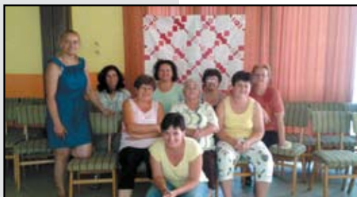
Szorgos kezek csoportja