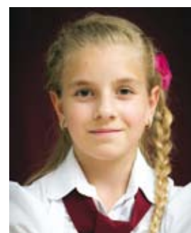
Kiss Dalma 4. b