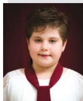
Nagyvárad Dorka 2. b