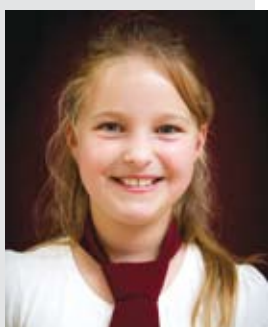
Kiss Karina 3. b