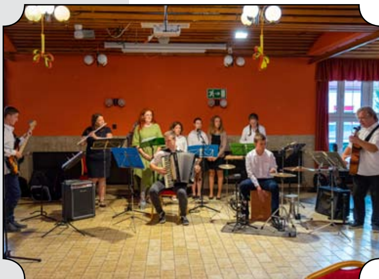
Harmadik est a rossz időjárás miatt a Béke Étteremben került megrendezésre, a jánoshalmi Hetvenszer Hétszer Együttes közreműködésével.