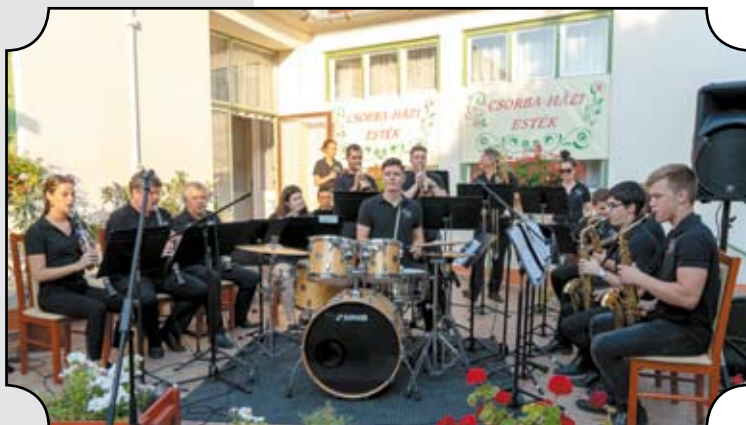
Második alkalommal a kiskunhalasi Halas Jazz Band műsora hangzott el.