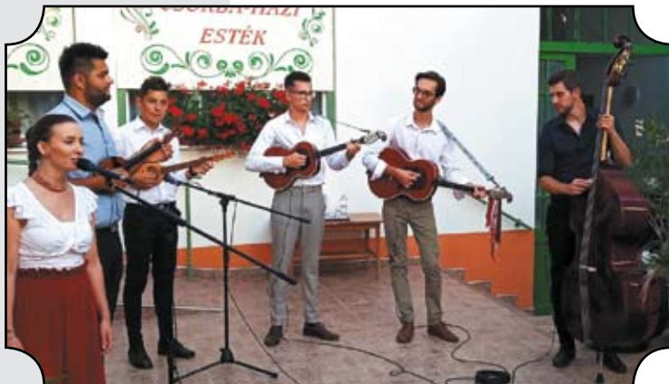
Első este a bátai Pántlika Tamburazenekar lépett fel.

Ismét nagy érdeklődés kísérte a fellépő együttesek műsorát, melyeken népzene, fúvósszene, egyházi gitáros könnyűzene is szerepelt.