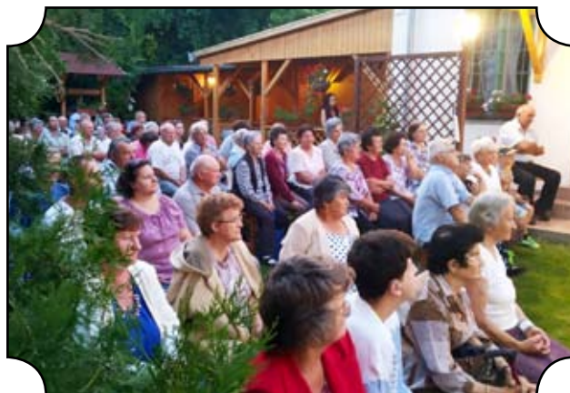
A Csorba-házi estéken teltházassal fogadta a fellépő együtteseket.