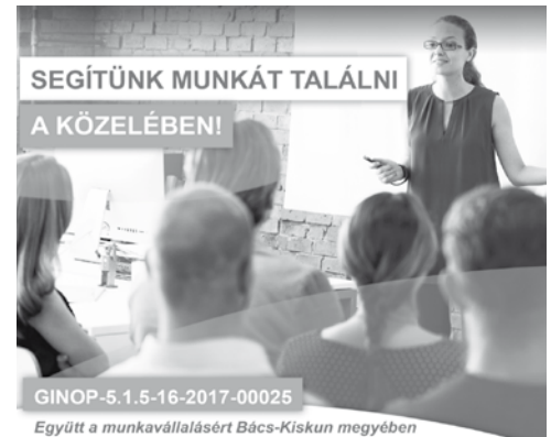
Együtt a munkavállalásért Bács-Kiskun megyében